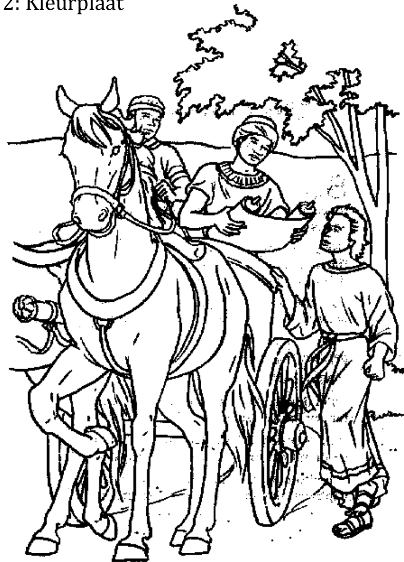
Filippus ontmoet de Moorman