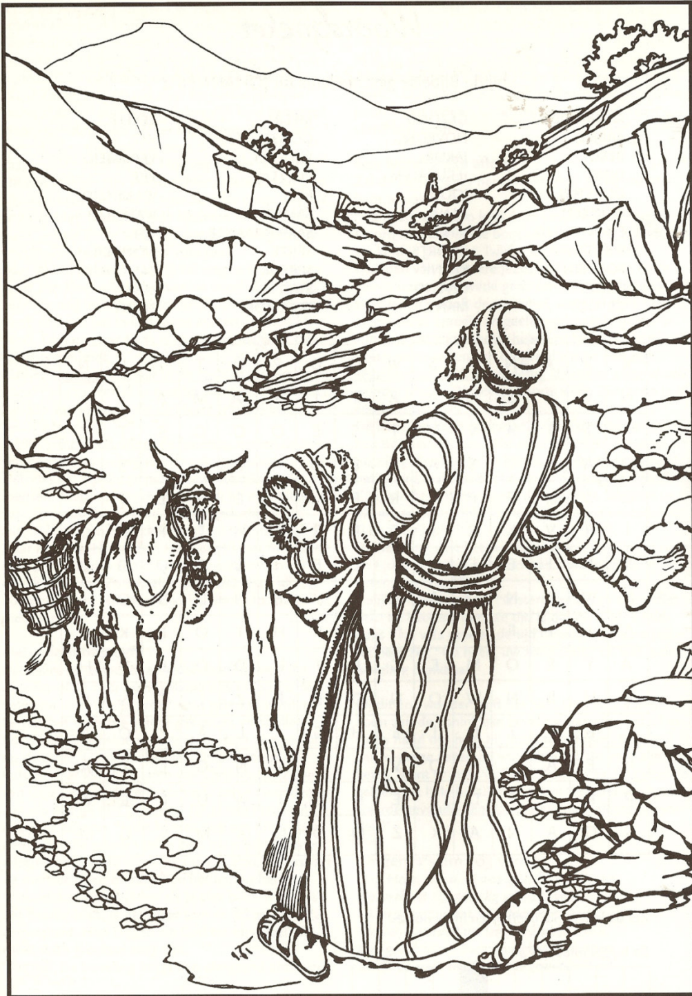
De barmhartige Samaritaan bewijst naastenliefde Lukas 10:34

Stuur de oplossingen of de kleurplaat naar: puzzelpagina@jwij.nl of lever ze in bij H. Heldoorn, Plasweg 9, IJsselmuiden. Vergeet je naam niet te vermelden en het nummer van de puzzelpagina. Voor elke mooie kleurplaat of goede oplossingen van de puzzels, krijg je 1 punt. Bij 10 punten krijg je een boekenbon. (Alleen voor kinderen die op de basisschool zitten) Veel puzzel- en kleurplezier!