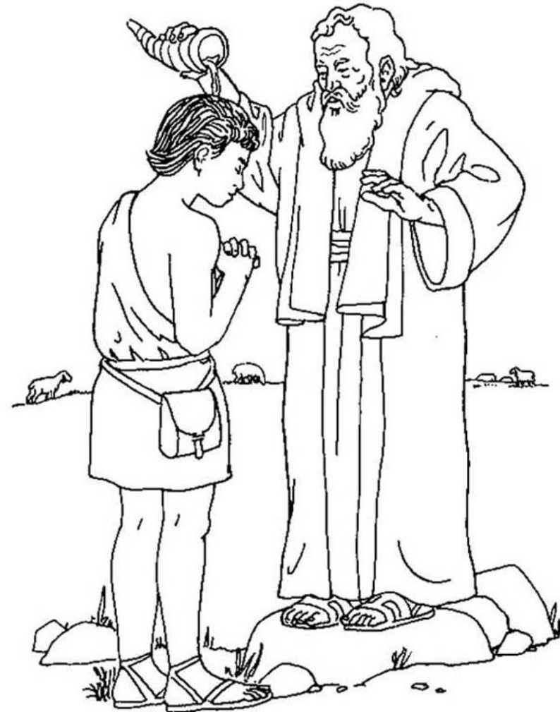
David wordt tot koning gezalfd