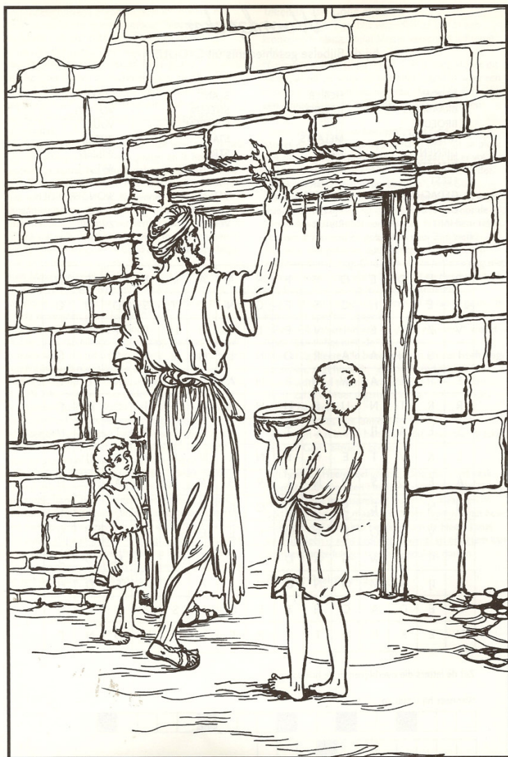
Het bloed aan de deuren Exodus 11:7