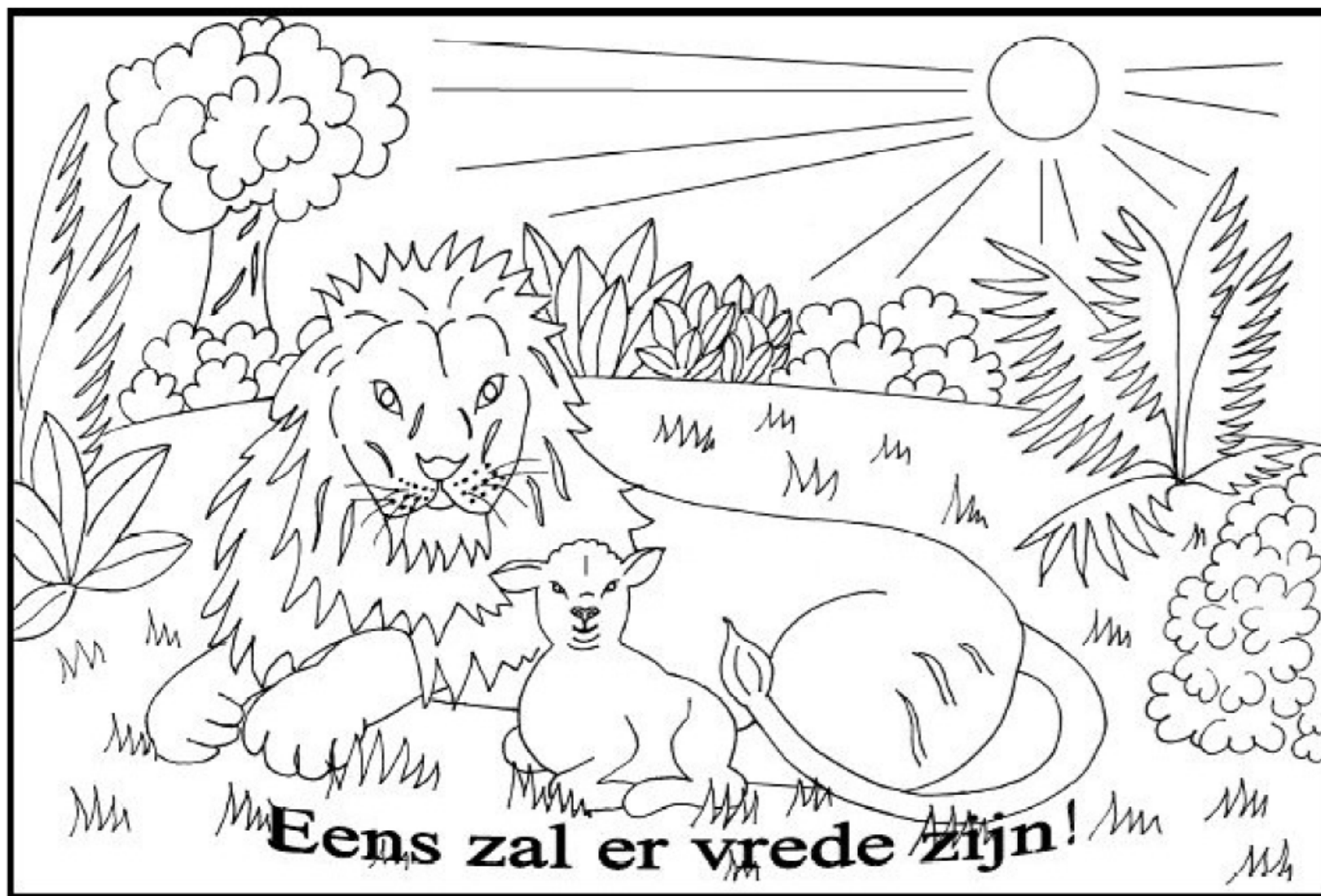
Jesaja 11:6a; En de wolf zal met het lam verkeren.